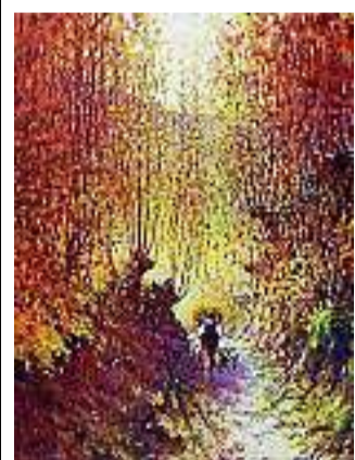
Un'opera di Losio

Vernissage trentino per il pittore bresciano Giambattista Losio che nei giorni scorsi ha inaugurato la sua ultima personale «I colori del silenzio» nella Sala civica di Andalo.