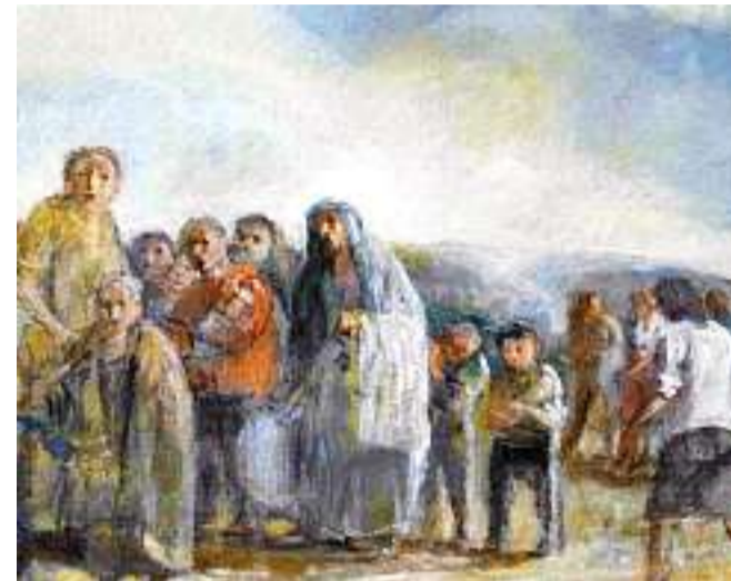
«Lesodo», un'opera di Cento Rossi

In tale contesto, spesso, valorizza il recupero di valori decorativi reinventando impostazioni da cui emergono simmetrie declinate in armonia e proporzione.